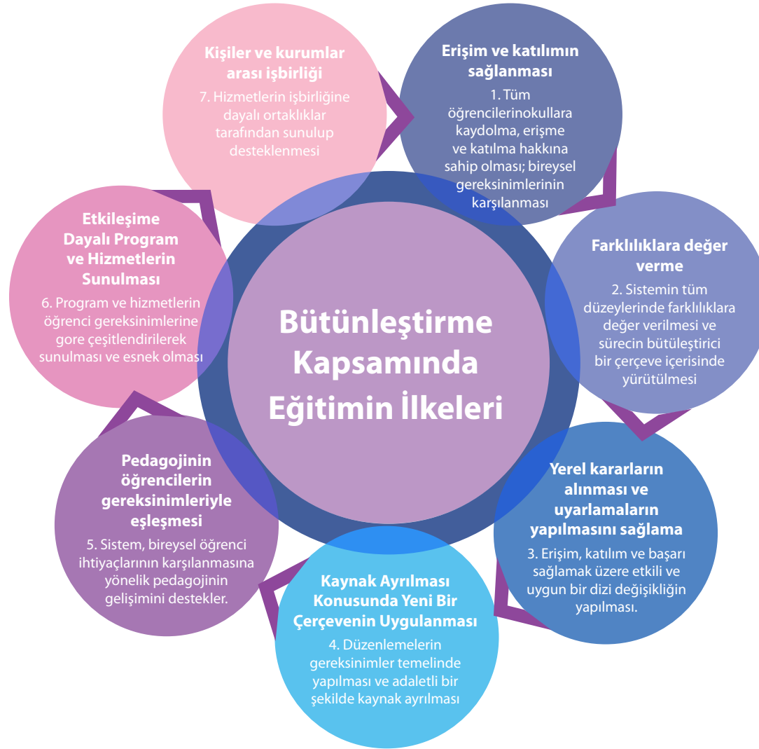
Şekil 2: Bütünleştirme kapsamında eğitim ilkeleri